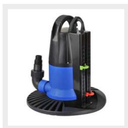
Pompa svuota telo per coperture invernali piscina