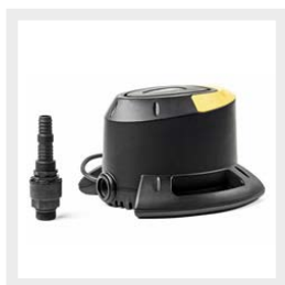
Pompa sommersa EUROCOVER per coperture invernali piscina

ATTENZIONE: queste coperture non garantiscono la sicurezza contro la caduta in acqua di persone o animali.